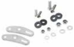
Fussverlängerung Hinterradträger Art. 70024