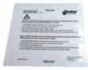
Schutzfolien-Set Art. 79005