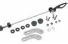
Für Montage des HR-Trägers am Ausfallende ohne Ösen. Schnellspanner- Adapter HR-Träger Art. 71500