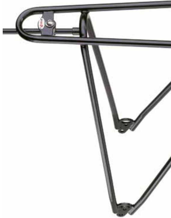
26" / 28" Art. 40000 (Schwarz / black / noir)