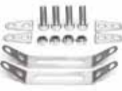
Schellen-Adapterset Art. 71614 / Art. 71616 Art. 71618 / Art. 71621 Art. 71624