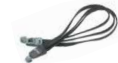
Spanngurt 3-fach „tubus“ Art. 75050