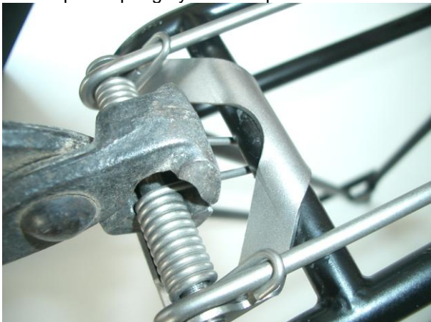
3. Blech mit der Rundung über die hintere Querstrebe stecken. Die Feder muß unter(!) der Strebe sein. 3. put the sheet metal with the round end over the rear cross-stay. The spring has to be below the stay !