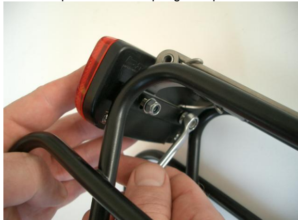
5. montieren Sie nun das Rücklicht /Reflektor 5. now mount the rear-light/reflector