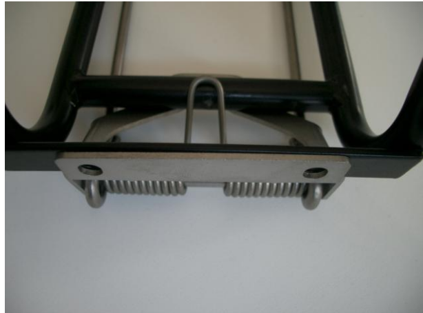
4. richtige Einbaulage der Federklappe 4. correct position of the spring-clamp