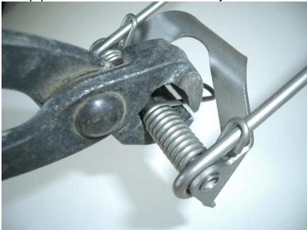
2. Feder mit Kneifzange nach unten spannen 2. clamp the spring by use of a pincer