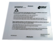
Schutzfolien-Set Art. 79005