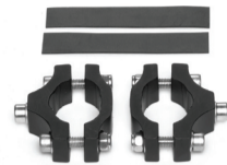
LM-1 Montageset für Gabeln ohne Ösen Art. 72100