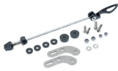
Für Montage des HR-Trägers am Ausfallende ohne Ösen. Schnellspanner-Adapter HR-Träger Art. 71500