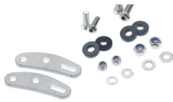
Fussverlängerung Hinterradträger Art. 70024