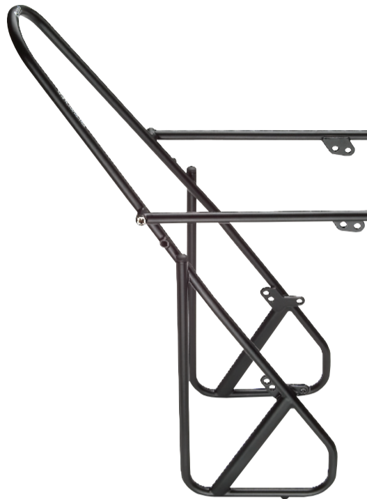
26" / 28" Art. 81000 (Schwarz / black / noir)