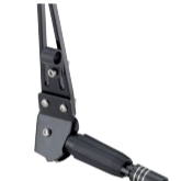
Ständer für Lowrider mit Adapterplatte Art. 73000