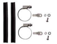
LM-BF Montageset für Gabeln ohne Ösen Art. 72200