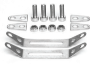
Schellen-Adapterset Art. 71614 / Art. 71616 Art. 71618 / Art. 71621 Art. 71624