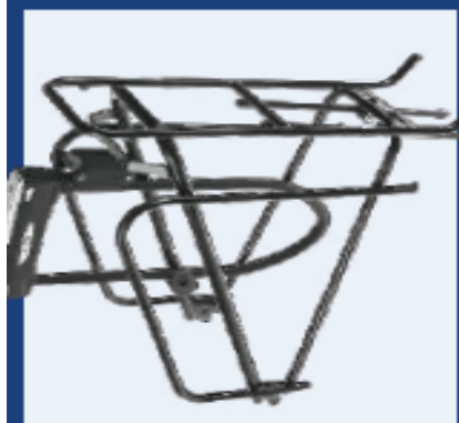
TUBUS Locc (ABUS Granit Schloss extra)

Vertrieb Tubus Carrier Systems GmbH, Tel. 0251/143223-0, www.tubus.com Preis / Farbe ca. 113 Euro / titansilber Breite x Länge oben 12 x 35 cm Größe(n) / Klicksystem 1x für 26" und 28" / keins Material / Gewicht* / Zuladung Edelstahl / 755 g / 40 kg tiefe seitl. Aufhängung / Rohrdurchmesser ja / 10 mm Der Edelstahlträger Cosmo wurde überarbeitet. Er hat eine breitere Auflagefläche bekommen, das Rücklicht ist besser geschützt, und die Tragfähigkeit ist mit 40 Kilogramm jetzt genauso hoch wie bei den Chrom-Molybdän Stahlträgern von Tubus. Da er aber aus Edelstahl ist, ist er nicht nur unempfindlich gegen Rost, sondern sieht auch ziemlich gut aus. Angesichts seiner Vorzüge ist der Preis gerechtfertigt.