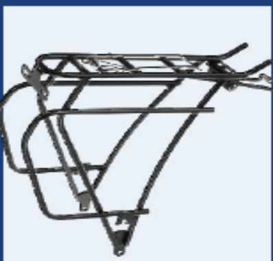
XTREME Grand Tour CroMo

Vertrieb Tubus Carrier Systems GmbH, Tel. 0251/143223-0, www.tubus.com Preis / Farbe ca. 91 Euro schwarz / ca. 96 Euro silber Breite x Länge oben 8,6 - 10,2 x 32,5 cm Größe(n) / Klicksystem 1x für 26" und 28" / keins Material / Gewicht* / Zuladung Alu / 726 g / 40 kg tiefe seitl. Aufhängung / Rohrdurchmesser ja / 10 mm Beim Tubus Logo können Seitentaschen 45 mm tiefer eingehängt werden. Die Plattform des Logo ist flach und verläuft leicht keilförmig; vorne schmal, hinten breiter. Wie bei Tubus üblich, können die vorderen Verbindungsstreben leicht an ziemlich jede Rahmengröße angepasst werden. Sehen erschienen ist der Logo in Titan. Er ist über 200 Gramm leichter, trägt 30 Kilo, und kostet ca. 200 Euro.